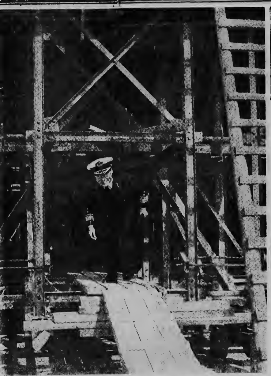
Na ocasion di 200 anja cu admiraliteitsraad di marina hulandes a sinta, ministro ir. C. Staf a dicidi di haci un excursion cu e miembronan di e raad na e terreno caminda nan ta trahando e tunnel di Velsler, y tambe un reunion chiquito a worde teni ei den un kreet di directie cu tin riba e terreno. E foto aki ta duna un idea di e bishita na e trabao, tambe por weita S.A.R. Principe Bernhard, un miembro di e raad, kende ta saliendo for di tunnel.